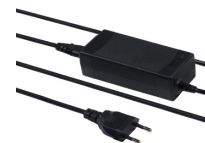
48 WATTS POWER SUPPLY